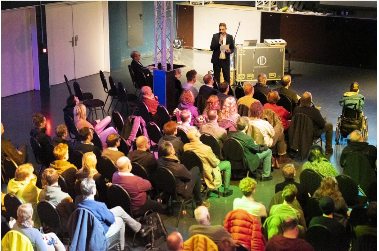
Abbildung 8: Feedback-Veranstaltung in Münsters Musikhalle Jovel (Miriam Juschkat)