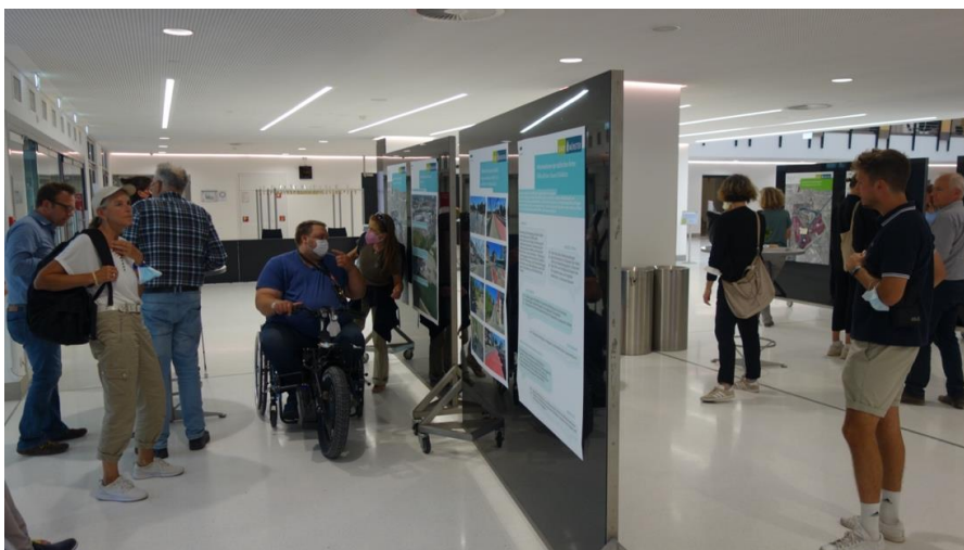
Abbildung 7 – Gemeinsamer Besuch einer Beteiligungsveranstaltung in der Halle Münsterland (02.09.2022, Münster Modellquartiere 3-5)

„Und ich habe dabei Neues gelernt. Zum Beispiel, dass die unterschiedlichen Vorstellungen von ‚Barrierefreiheit‘ nicht immer miteinander verträglich sind.“