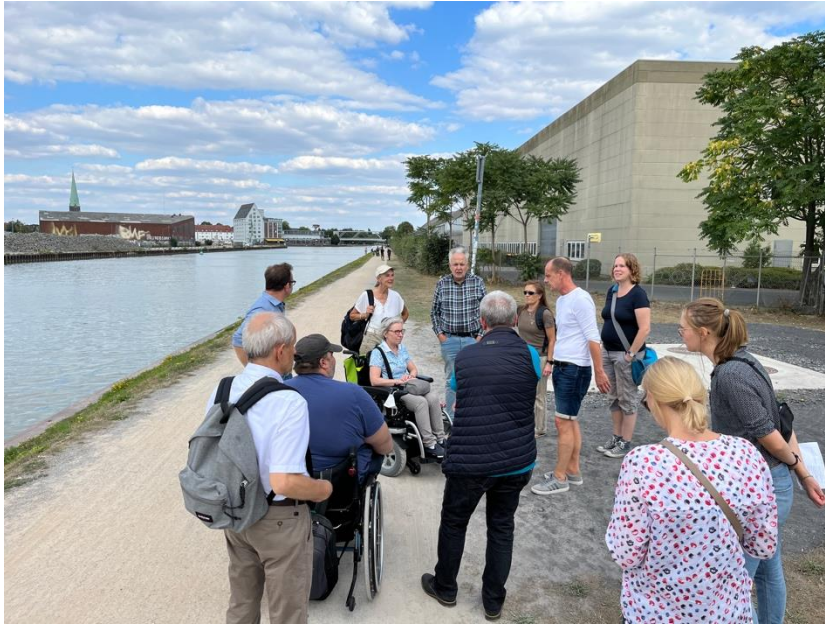
Abbildung 6 – Spaziergang am Kanal in Münster im Rahmen einer Beteiligungsveranstaltung in der Halle Münsterland (02.09.2022, Münster Modellquartiere 3-5)

„Spannend zu erleben und mitzugestalten, was man aus einem bestehenden Ort machen kann und wie dieser gestaltet wird und die Möglichkeit gegeben wird, diesen Ort zu besichtigen.“