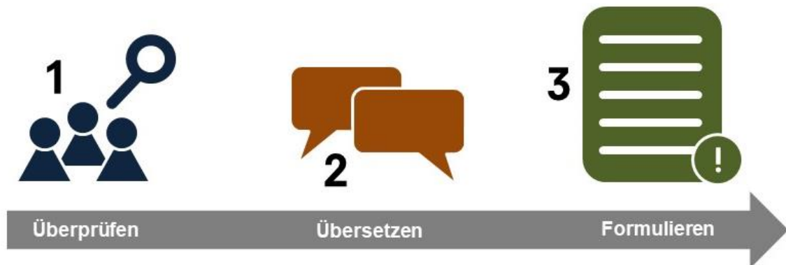
Abbildung 5 – Von Erfahrungen zu verbindlichen Kriterien

Die Erfahrungen wurden auf den oben genannten, ganz verschiedenen Wegen – durch die Beteiligungspilotinnen und Beteiligungspiloten berichtet, durch das begleitende Büro ausgewertet und in verbindliche Kriterien und Empfehlungen für eine inklusivere Beteiligung übersetzt. In der regelmäßigen Runde der Projektbeteiligten gab es umfassende Diskussionen zum aktuellen Stand inklusiver Beteiligung bei der Stadt Münster und der Umsetzbarkeit der vorgeschlagenen Maßnahmen in der Verwaltungspraxis.