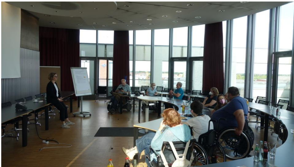
Abbildung 3 – Workshop der Beteiligungspilotinnen und Beteiligungspiloten

Insgesamt 31 Beteiligungspilotinnen und Beteiligungspiloten waren im Projekt dabei – 23 Frauen und 16 Männer unterschiedlichen Alters und mit unterschiedlichen Formen von Behinderung. In drei Workshops hatte die Gruppe Gelegenheit sich kennenzulernen und sich mit den Aufgaben als Beteiligungspilotin oder Beteiligungspilot vertraut zu machen. Alle Teilnehmenden haben in diesen drei Workshops Arbeitsmaterial erhalten, an dem sie sich bei der Überprüfung der Veranstaltungen und Formate orientieren konnten. Dieser für das Projekt entwickelte Kompass enthält Leitsätze, was vor, während und nach einer Veranstaltung wichtig ist, um sich gut beteiligen zu können (siehe Infokasten). 7