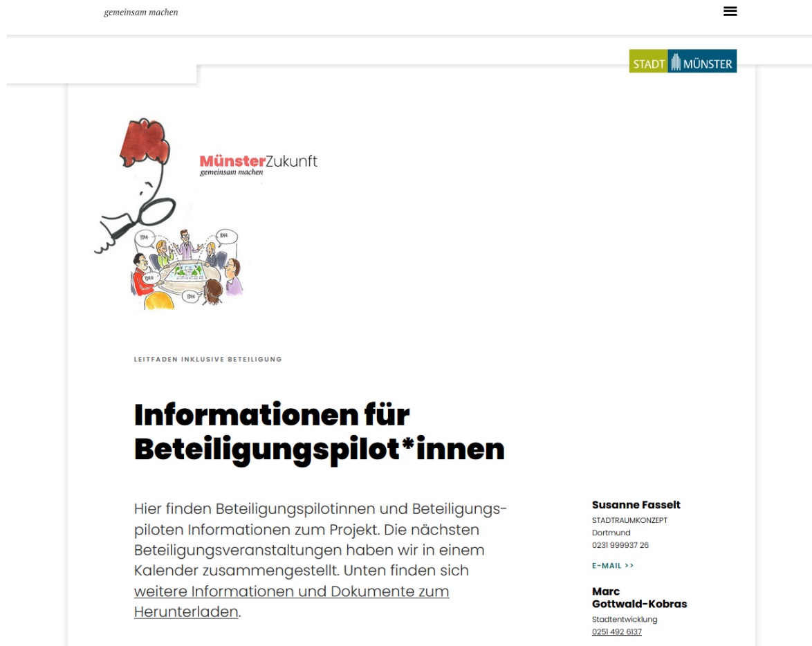
Abbildung 4 - Informationen und Beteiligungskalender in Münsters Zukunftsportal

Die Pilotinnen und Piloten konnten frei wählen, welche Veranstaltungen sie im Projektzeitraum besuchen wollten. Da es in Münster keine zentrales Beteiligungsportal gibt, wurde speziell für dieses Projekt eine Info-Seite mit allen aktuellen Beteiligungsangeboten für sie eingerichtet und laufend gepflegt, deren Adresse nur ihnen bekannt war.