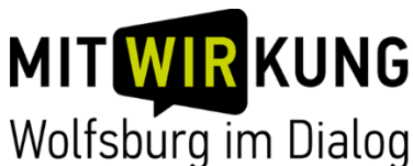
Abbildung 9: Logo der Wolfsburger Plattform „MeinWolfsburg“ für Beteiligung und Engagement!

Es ist heute üblich, dass Kommunen alle aktuellen Beteiligungsmöglichkeiten und eventuell interessante verwandte Angebote in einem zentralen Beteiligungsportal bündeln. Diese haben oft sehr einladende „sprechende“ Namen und Internetadressen wie „Frankfurt fragt mich“, „MEINung für KÖLN“ oder auch „Talbeteiligung“ (für Wuppertal). Hier gibt es oft direkt digitale Beteiligungsmöglichkeiten, Veranstaltungseinladungen und Infos über umfangreichere Beteiligungsprozesse (inklusive der Vor- und Nachbereitung von Veranstaltungen). Auch ist oft eine Registrierung möglich, um sich beizeiten zu Vorhaben in bestimmten Themenfeldern oder Stadträumen informieren zu lassen („Planning Alert“). Gerade für Menschen mit Behinderung ist im Projekt deutlich geworden, dass schon die bloßen Informationen über das Ob von Beteiligungsmöglichkeiten sie nicht erreichen. Und es ist klargeworden, dass sie es nicht leisten können, für ihre tatsächliche Teilhabe essenzielle Informationen über das Wie, wann und wo der Beteiligungsangebote von Webseiten verschiedener Ämter oder Projektwebseiten zusammenzusuchen.