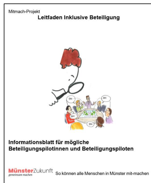
Abbildung 2 – Informationsblatt mit Kontaktdaten und einer Erklärung des Projekts in verständlicher Sprache

Informiert und gesucht wurden sie über bekannte Netzwerke (Vereine, Verbände, Einrichtungen) im Umfeld der Kommission zur Förderung der Inklusion von Menschen mit Behinderungen (KIB) der Stadt Münster, aber auch über die Presse. Im Zeitraum zwischen Mai und September 2022 sollten die Beteiligungspilotinnen und Beteiligungspiloten verschiedene Beteiligungsveranstaltungen und -angebote besuchen und testen, wie gut sie dort zurechtkommen und sich einbringen können. Begleitet hat das Projekt ein Beirat aus erfahrenen Mitgliedern der KIB und der Regionalkonferenz 6 , einer Vertreterin der wissenschaftlichen Teilhabeforschung und Verwaltungs-